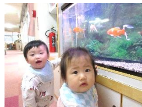
おおきい 金魚み〜つけた 🐟