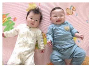
はじめての おともだち 🌟